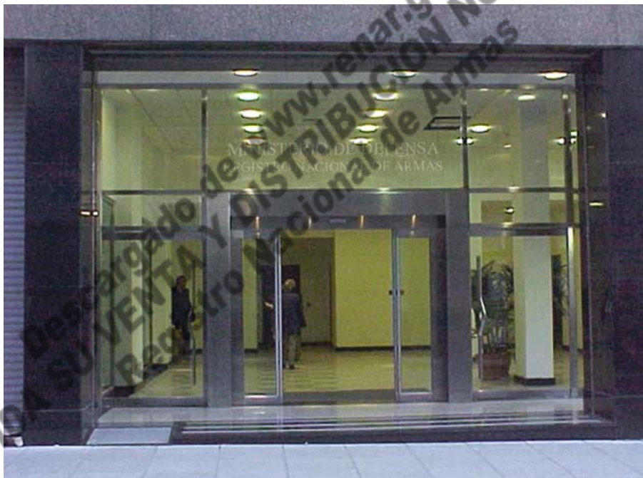
HALL DE ACCESO AL NUEVO EDIFICIO DE LA SEDE CENTRAL DEL RENAR SITA EN BME. MITRE 1469 CAPITAL, ADQUIRIDA CON FONDOS PROPIOS DERIVADOS DE LA APLICACION DE LA LEY 23.979.

El material de resistencia balística satisface los requerimientos de la Norma MA.02, cuando la probeta de ensayo iguala o supera las especificaciones de la tabla N°1.